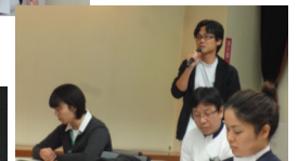
発表者は、待っている間もドキドキ...