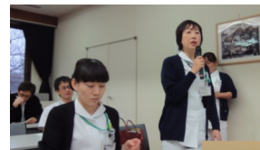
病棟師長・副師長より、取り組み効果や苦労話など、発表後にコメント