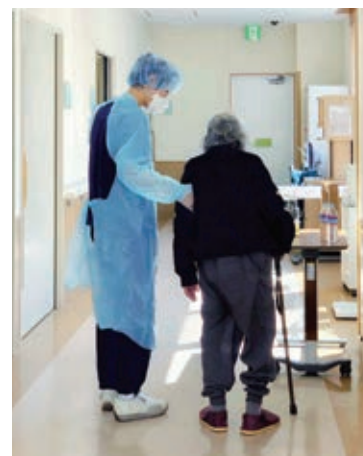
病棟内での歩行訓練の様子

疲労症候群との症例の重なりも注目されています。COVID-19後遺症についてはまだ分かっていないこともあって症状も多様なのですが、着実な対応に努めているところです。ワクチン接種後の不調の相談も来ています。今後は他の医療機関とも連携して後遺症に