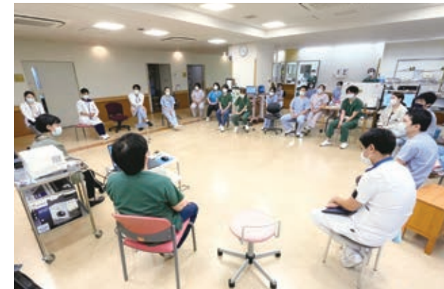
多職種のスタッフによるカンファレンス風景