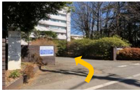
⑦ 左側にある研究所入口を入ります