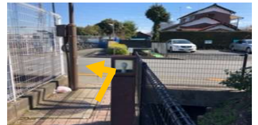
④ 道路に出たら左へ曲がり、 まっすぐ歩きます