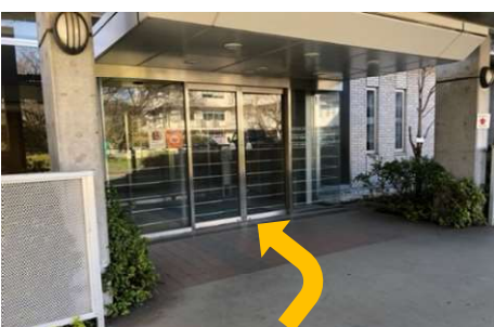
⑬ 3号館の入り口を入ります