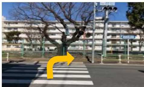
⑥ つきあたりの小平郵便局西の 横断歩道を渡ります 渡ったら右へ歩きます