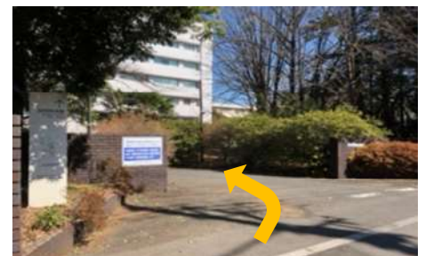
⑦ 第一パンの前をすぎ 左側にある研究所の入口を 入ります