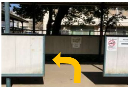
⑩ 渡り廊下を左へ進みます