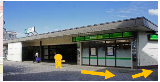
① 階段を上がって、改札を出ます 改札は1つです 改札を出たら左へ行きます