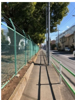
⑤ ひたすらまっすぐに 歩きます