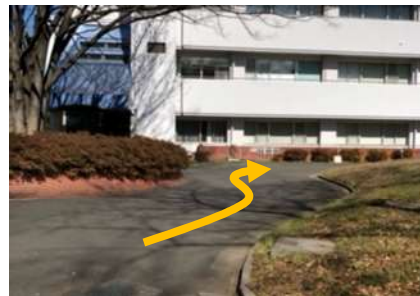
⑧ ロータリを右側へ歩きます