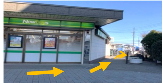
② 改札の左側のNewDaysの 前を過ぎてNewDaysの角を 左へ曲がります