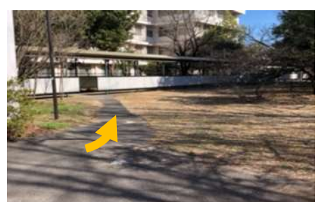
⑨ 渡り廊下を目指します