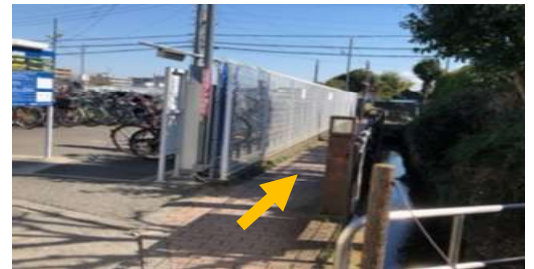
③ 駐輪場と小さい川の間を 右へ曲がり、小道を歩きます