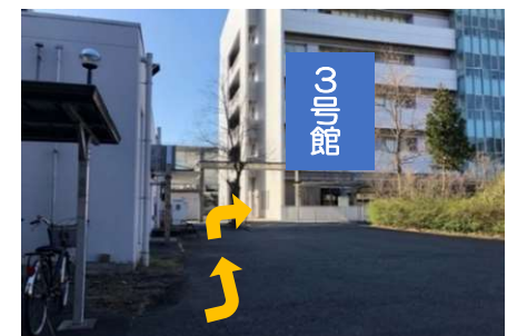
⑫ 駐輪場を抜けたら、左に曲がります。 右斜め前の5階建ての建物が3号館です