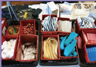
注射器交換プログラム (米国、サンフランシスコ)