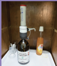
メサドン治療 (インドネシア、パリ)