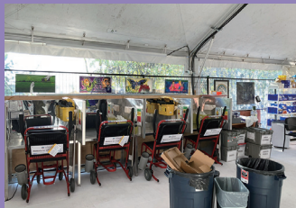
薬物使用ルーム (カナダ、バンクーバー)