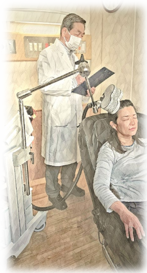
※画像はイメージです。 実際とは異なる場合があります。