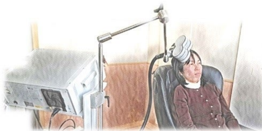
※画像はイメージです。実際とは異なる場合があります。