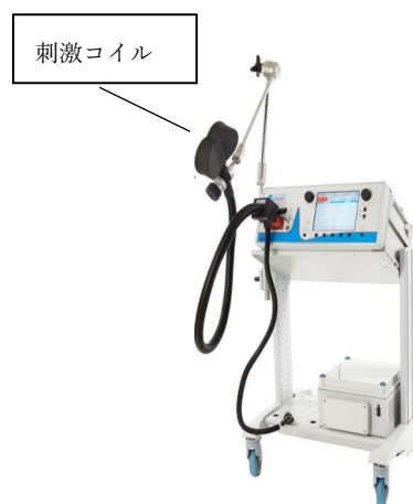
使用する磁気刺激装置