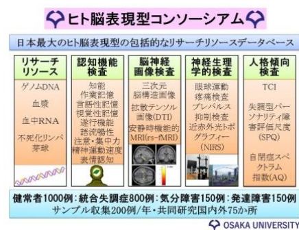
図4 ヒト脳表現型コンソーシアム

本研究は、大阪大学医学部附属病院神経科・精神科にて、今までに集積してきた日本随一の精神疾患のリサーチリソース・データベース「ヒト脳表現型コンソーシアム」を活用して得られた成果です(図4)。臨床研究における中核的な拠点である大阪大学医学部附属病院では、トランスレーショナル・リサーチを推進していますが、神経科・精神科では、詳細な脳機能データの付随する血液サンプルを 3000 例以上集めています。ヒト脳表現型コンソーシアムを発展させ、COCORO ※4 を設立しALL JAPANの共同研究体制で、統合失調症患者の認知・社会機能プロジェクトなど、様々なプロジェクトに取り組んでいます。