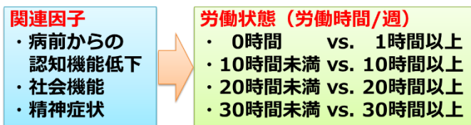
図 1 労働状態の推定

米国科学雑誌 Schizophrenia Research に平成 30 年 6 月 28 日(午後 8 時:日本時間)に発表されました。