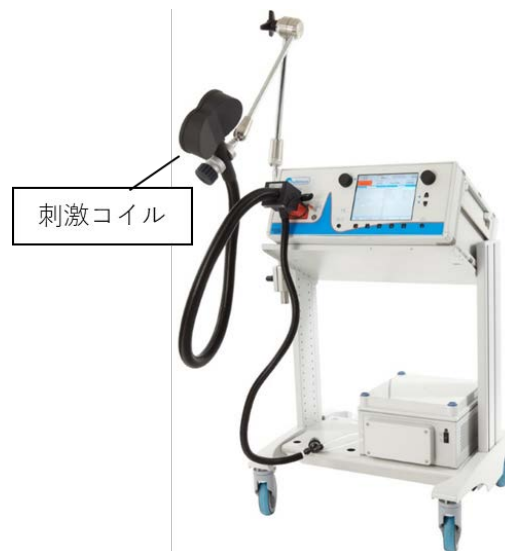
使用する磁気刺激装置